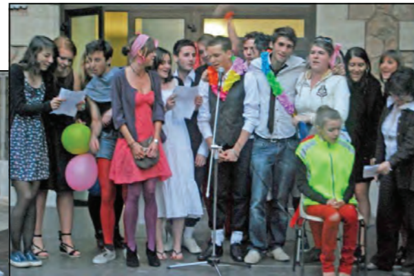
Costumes variés, couleurs gaies, convivialité...