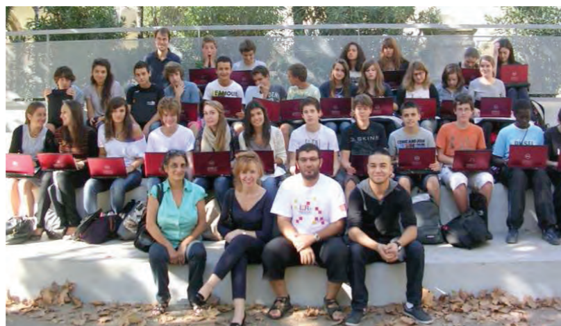
Les heureux bénéficiaires et leurs ordinateurs à la couleur de la Région